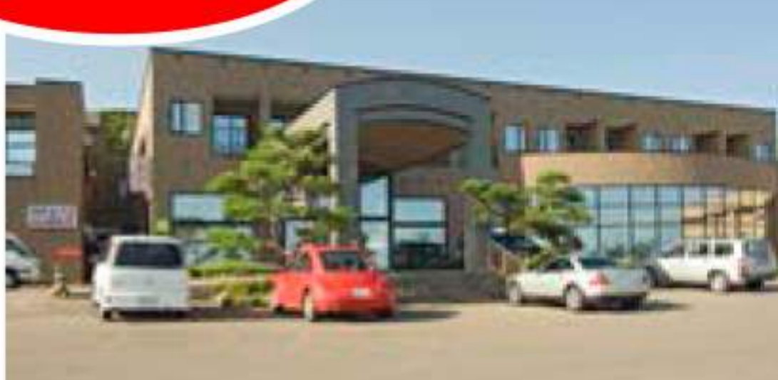
■温泉ホテル「遊楽亭」