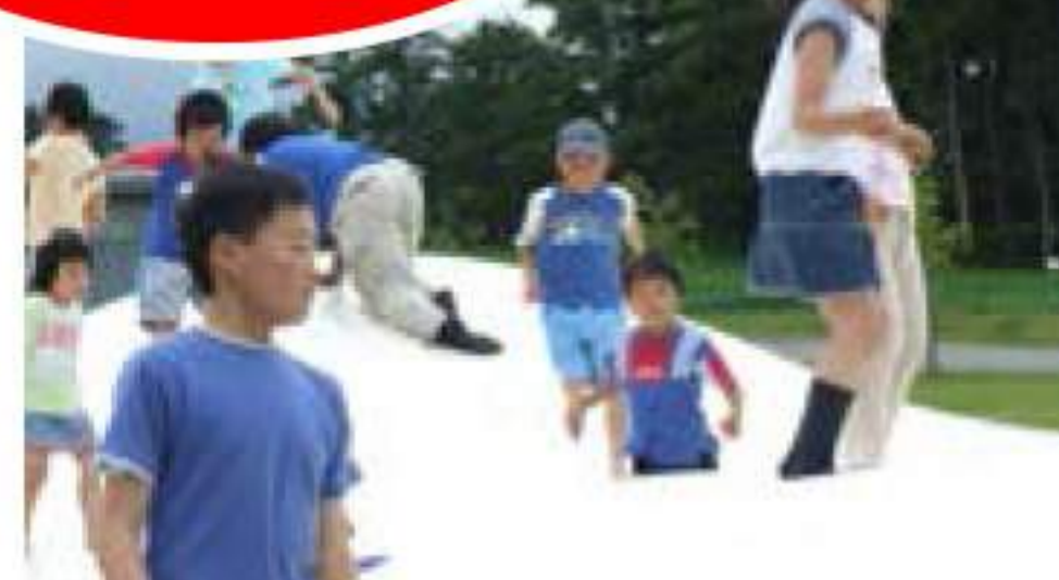
■まきばの冒険広場